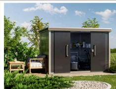
STAUHAUS IM GARTEN