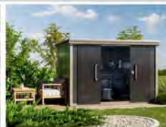
STAUHAUS IM GARTEN